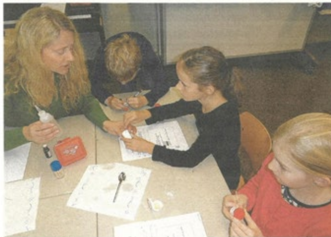
Zahn- und Mundgesundheit ist das Thema an der Norbertschule